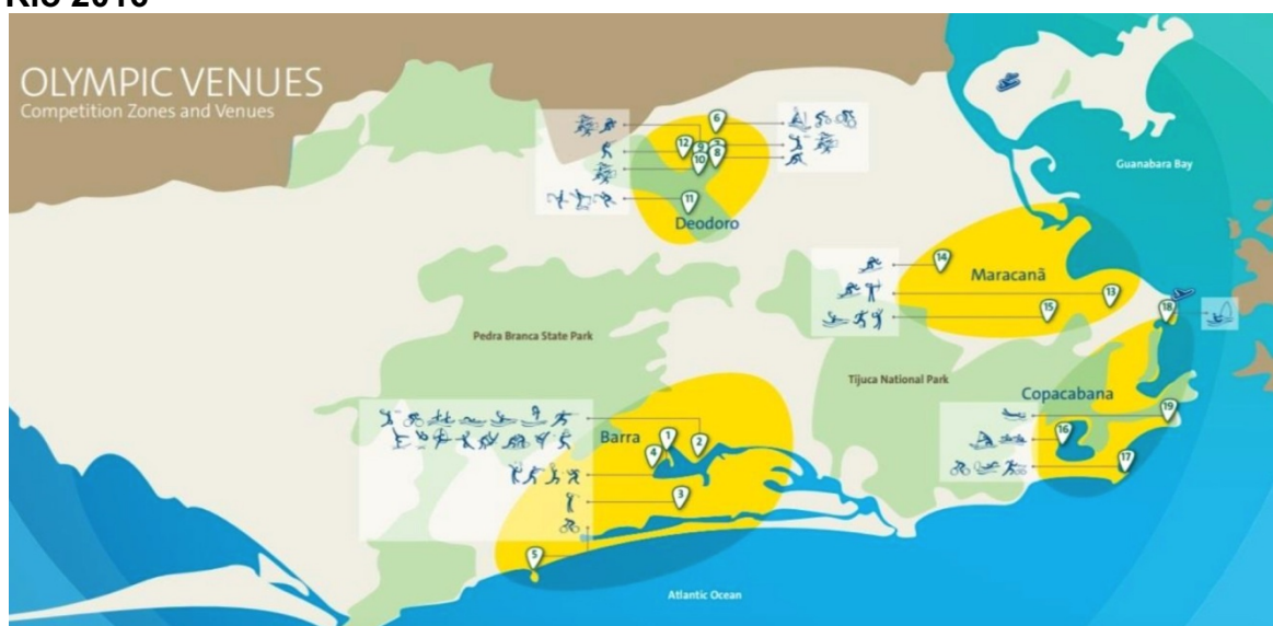
FIGURA 1 - Distribuição das instalações esportivas nas 4 regiões olímpicas na Rio 2016

Na candidatura vencedora, assim, como na candidatura de 2012, as instalações olímpicas foram distribuídas em 4 regiões olímpicas: Barra, Deodoro, Copacabana e Maracanã, dispersando os Jogos por uma área bastante significativa da cidade, conforme a Figura 1 (CET-RIO, 2016).